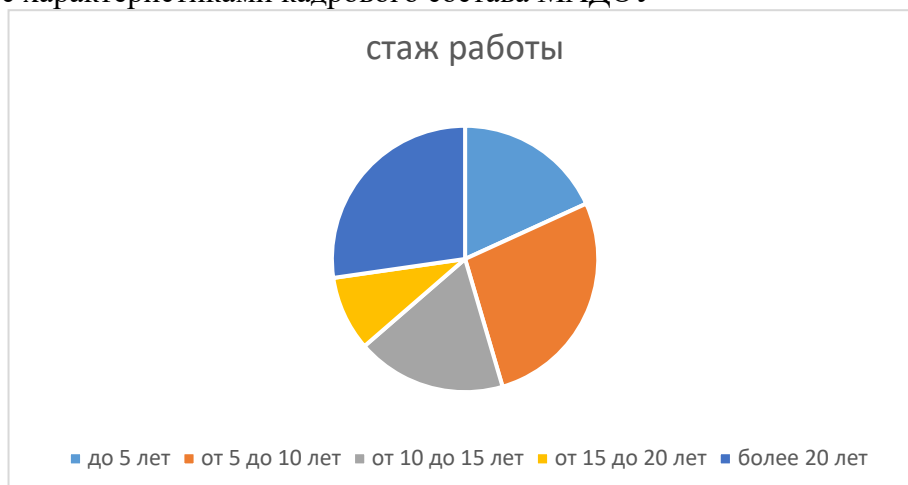
Диаграмма с характеристиками кадрового состава МАДОУ

Курсы повышения квалификации в 2023 году прошли 12 работников МАДОУ, из них 12 педагогов.